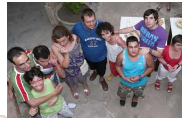
Alguns usuaris de PRODIS

Com s'ha dit, tenen uns impulsos sexuals, com tots els éssers humans, que no comprenen si nos els hi explicam. Saben que els agraden els petons i les carícies, com es natural, i és massa fàcil que algú es pugui aprofitar de la seva innocència i falta de informació. Aquest és el motiu principal pel qual una educació sexual es fa tan necessària. No es tracta d'estimular la sexualitat de ningú, sinó de ensenyar-los que el seu cos és seu i que ells són els que han de decidir qui els pot tocar i qui no i quines precaucions s'han de prendre, com una manera més de potenciar aquesta autonomia seva de la que tant parlem i que tant treballam. Part d'aquesta autonomia consisteix en donar-los la possibilitat de decidir sobre les possibilitats que tenen, si volen explorar-les o no i amb qui, ja que s'ha de recordar que la sexualitat està molt lligada a l'afectivitat, un pilar bàsic en la vida de tota persona.