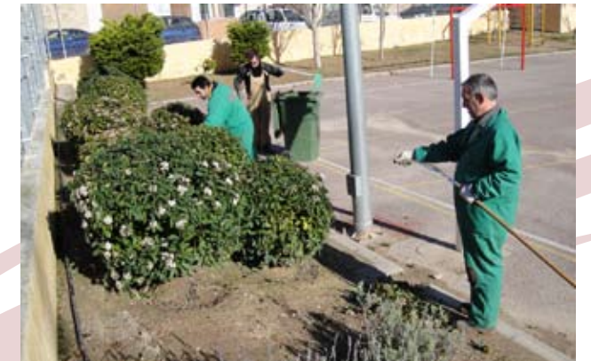
Alguns dels usuaris del taller de jardineria

patis i jardins al mateix temps que ens ofereixen oportunitats de feina i contribueixen a la inserció d'un col·lectiu vulnerable.