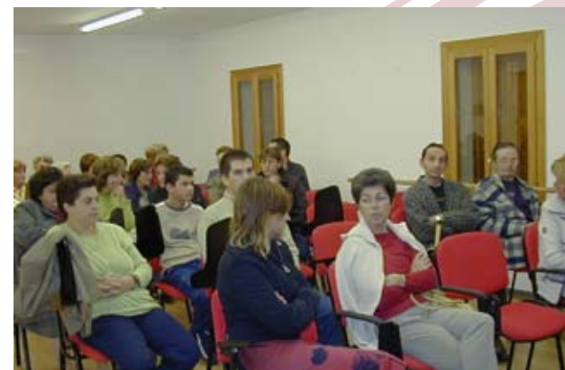
Usuaris i familiars de PRODIS a unes xerrades

era insubmergible. I ens equivocam, com els creadors del "Titanic". La natura és molt forta i sempre troba el seu camí. Un dels fins primers de qualsevol espècie és la supervivència de l'individu i la reproducció de l'espècie, fortament impresos al nostre codi genètic. Fins i tot en casos de discapacitats molt severes, on es presenten moltes limitacions, és possible la reproducció, com demostra la menstruació de les dones i les ereccions dels homes. Per tant, els impulsos sexuals estan presents, i no es poden ignorar.