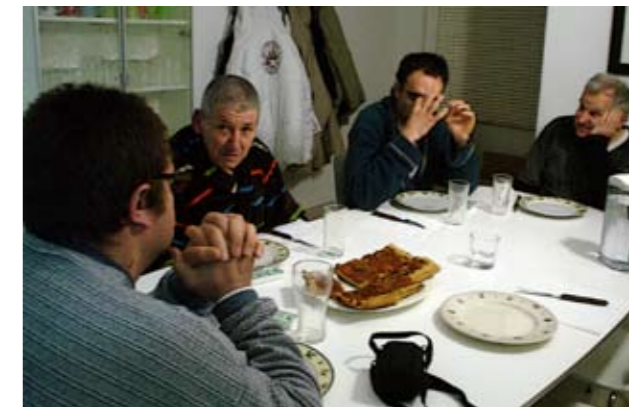
Els usuaris del pis tutelat compartint el sopar.

Estam iniciant una nova etapa plena de noves emocions de les quals us feim partícipes.