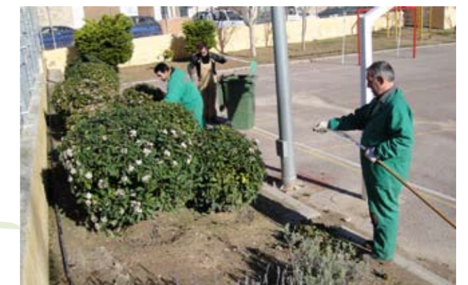
Alguns dels usuaris del taller de jardineria

Nomes queda (i cauré amb la possibilitat de ser massa repetitiu), que altres empreses del municipi, prenguin exemple i ens ajudin amb la inserció laboral de persones amb discapacitat. Un benefici mutu.