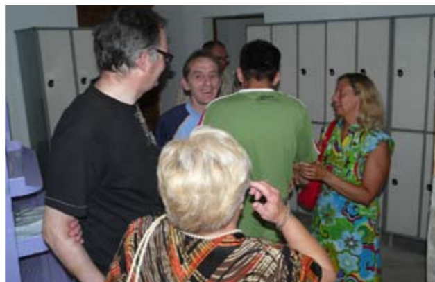
Alguns usuaris, famílies i gent vinculada a PRODIS

Cada família té una estructura que consisteix en la varietat de característiques que la converteixen en única. Els factors que fan aquesta estructura inclouen les característiques dels seus membres, el seu estil cultural, el seu estil ideològic i el tamany de la pròpia família. També és necessari tenir en compte les diferències entre famílies pel que fa al tipus de membres, i el fet de que les famílies poden canviar al llarg dels anys, amb l'arribada o la sortida d'algun membre.