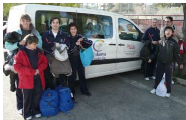
Els usuaris que participaren a l'esdeveniment.

SERVEI D'OCI AUBORADA - COMPARTINT EL TEMPS LLIURE