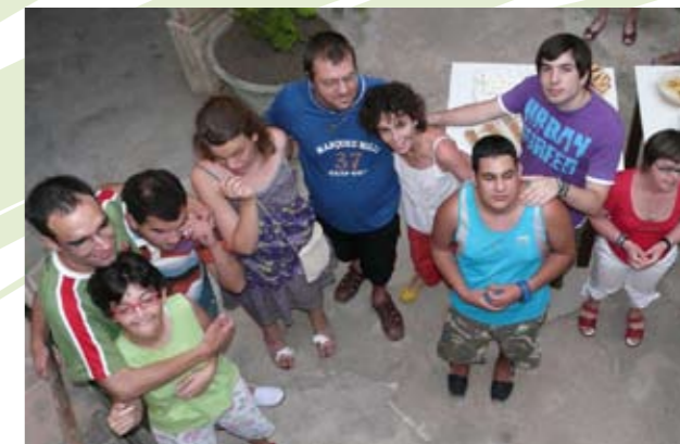
Alguns usuaris de PRODIS

l'acceptació del dèficit i del que comporta: us de mitjans específics i poques opcions per a participar en activitats lúdiques i oci compartides amb companys del col·legi, veïns, fins i tot familiars propers al nin. Per als pares, la cura implica prendre precaucions que poden resultar excessives. Es freqüent que es llevi al nin de moltes activitats que li exigeixen autonomia i determinació a més de restar-li oportunitats per a aconseguir unes relacions socials sanes.